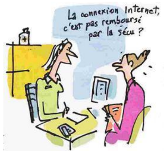
Paris, mars 2009