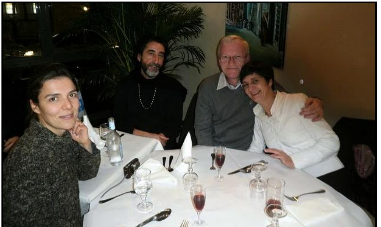
Paris, janvier 2010