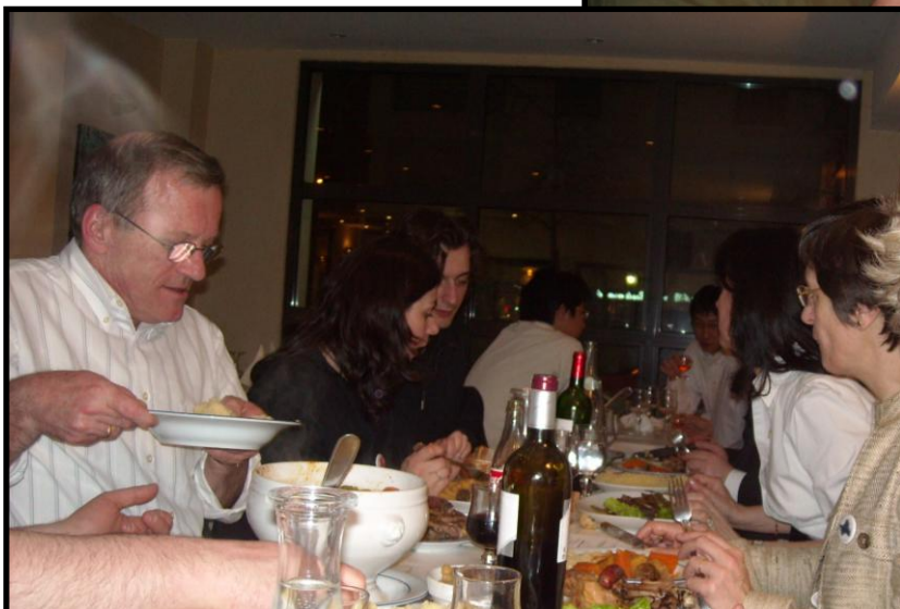
Paris, mars 2009